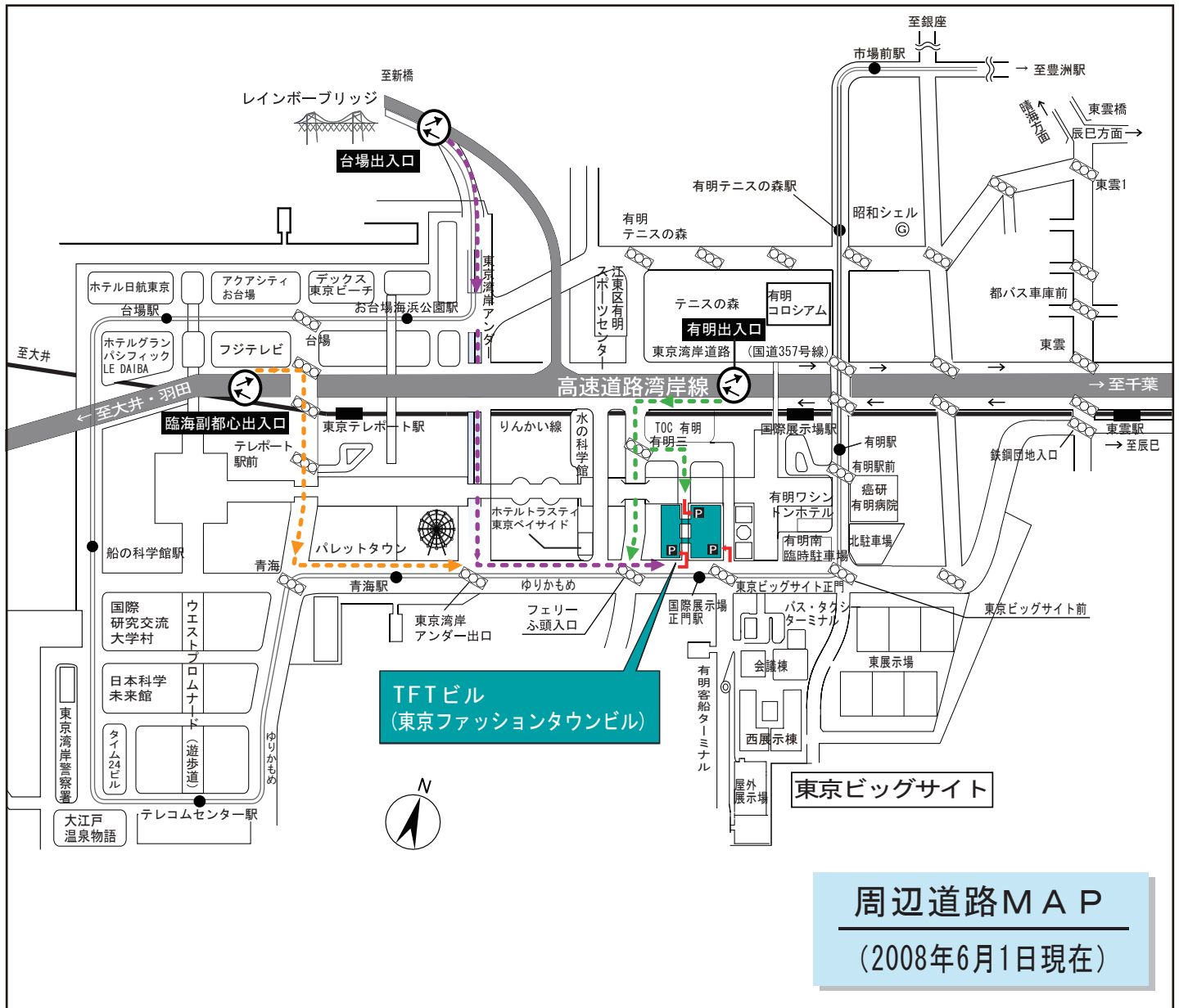
周辺道路MAP (2008年6月1日現在)